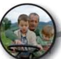
schaaiverbreding: zorg en wellness