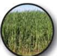
nieuwe gewassen: olifantgras en energieproductie