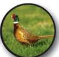
nieuwe/oude soorten: natuurbeheer en culinaire identiteit