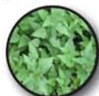
nieuwe gewassen: brandnetel en kledingproductie