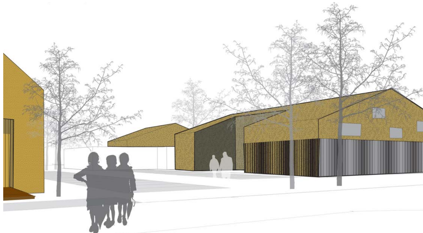
woningen en sportschool

De bibliotheek heeft een publieke functie en heeft een toegevoegde waarde voor het centrum van Grijpskerk. Wij stellen voor om haar te verplaatsen naar de Herestraat. Omdat wij in de bestaande huisvesting van de bibliotheek een kans zien die te gebruiken voor de sportschool stellen wij voor die te behouden. Door toevoeging van de nieuwe volumes in combinatie met het bestaande gebouw ontstaat een interessante ruimtelijke indeling van de buitenruimte rond de sportschool. Het concept is ontstaan uit een zoektocht naar een leesbare maat, een dorpseigen maat passend bij Grijpskerk en de specifieke plek in Grijpskerk. Het uiteindelijke ensemble van volumes en de sequentie van publieke en private buitenruimtes is tot stand gekomen door drie basis uitgangspunten op drie verschillende schaalniveaus. Dat zijn achtereenvolgens: de schaal van het dorp in relatie tot het ensemble, de schaal van de volumes in relatie tot specifieke elementen uit de locatie en de schaal van de verschillende programma onderdelen die een plek krijgen in de locatie.