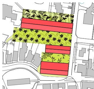
ritme van kappen