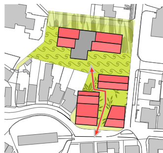
de sequentie van openbare ruimten