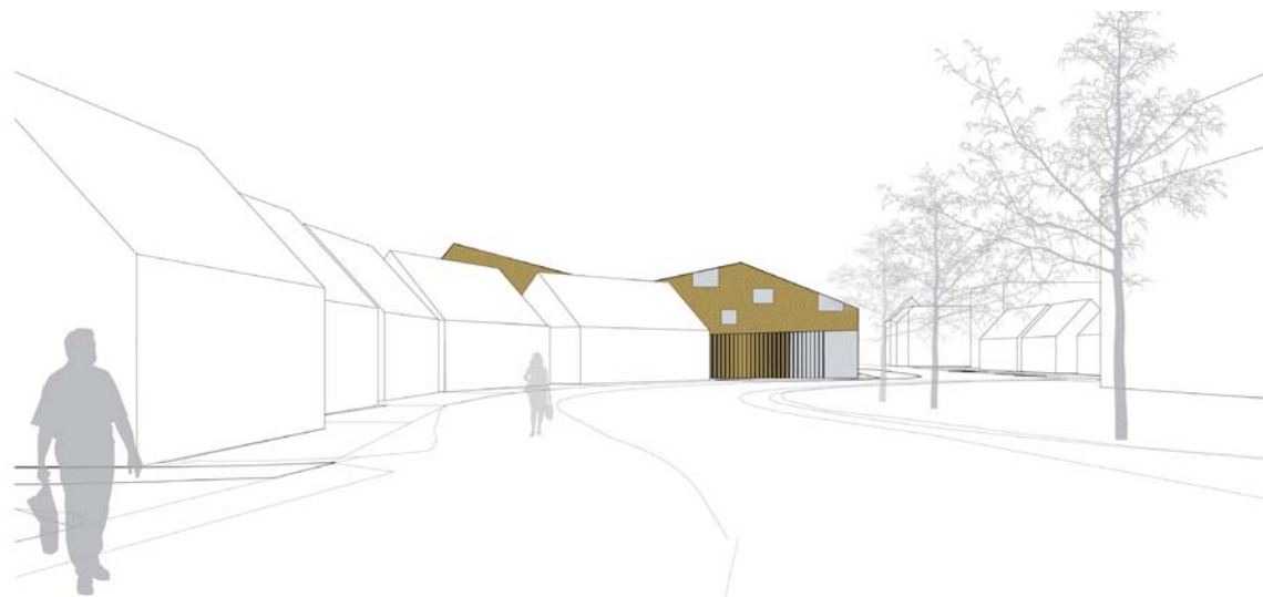
zicht op Herestraat