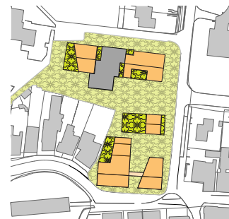
de volumes en privé buiten ruimtes