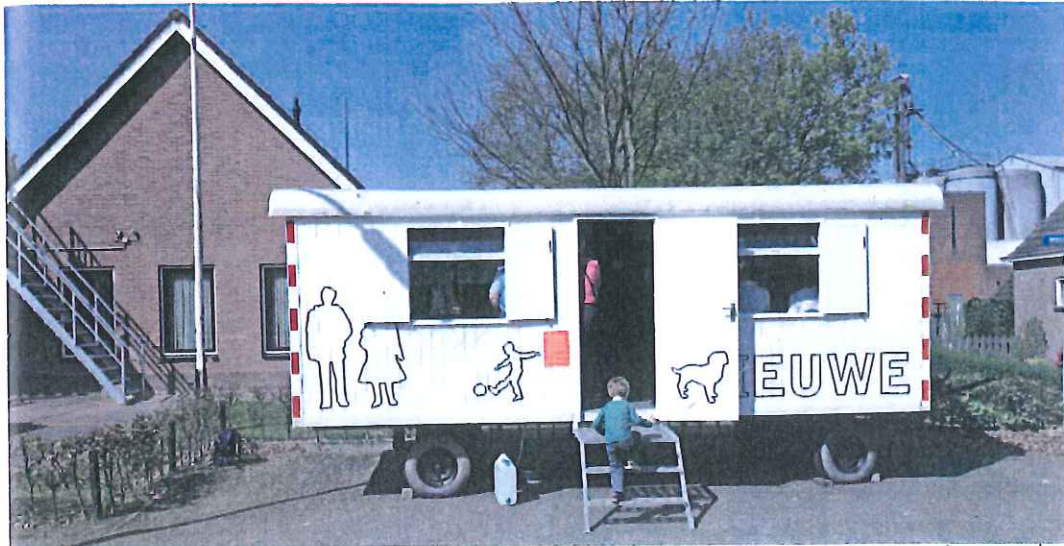
Project Nieuwe Erven, voor dorpen in Midden-Drenthe • architectenbureaus Onix en DAAD en fotograaf Peter de Kan gaan in de periode april - juli 2009 met een keet op toernee langs dorpen om met de bewoners te spreken over woonwensen en zorgbehoeften • met een mini-symposium op 8 juli 2009 • ( www.onix.nl , www.daad.nl , www.nieuweerven.info • foto's Peter de Kan