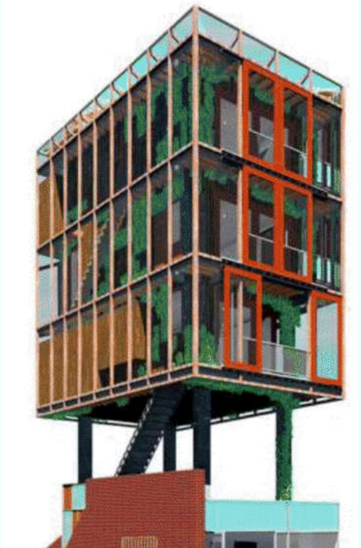
De digitale tekening van DAAD Architecten van de toren zoals die er zou kunnen gaan uitzien. Beneden komt de ontvangstruimte met daarop een tuin met grondbedekkers. Daarboven drie woonlagen waardoor de verticale tuin zich naar boven slingert.

Achter de glazen muren komen grote hoeveelheden klimplanten, die het glazen gevaarte het aanzien moeten geven van een metershoge tuin. Het is het alternatief voor een echte tuin, die hen voor ogen stond, toen ze het 'krotje'