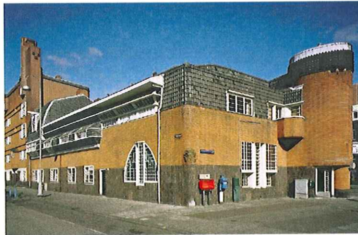
'Het Schip' in Amsterdam, populair bij architecten én leken

Ook de organische woningbouw van Alberts en Van Huut, wier werk bij collega-architecten op weinig waardering kan rekenen, is bij leken niet zo populair als een recente architectuurverkiezing deed vermoeden.